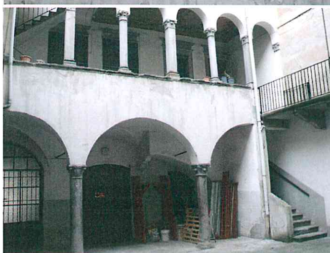
In alto: a sinistra, vista del fronte su via Pignolo; a destra, il doppio loggiato del primo cortile In basso: dettaglio di una finestra del piano nobile e del portico del primo cortile