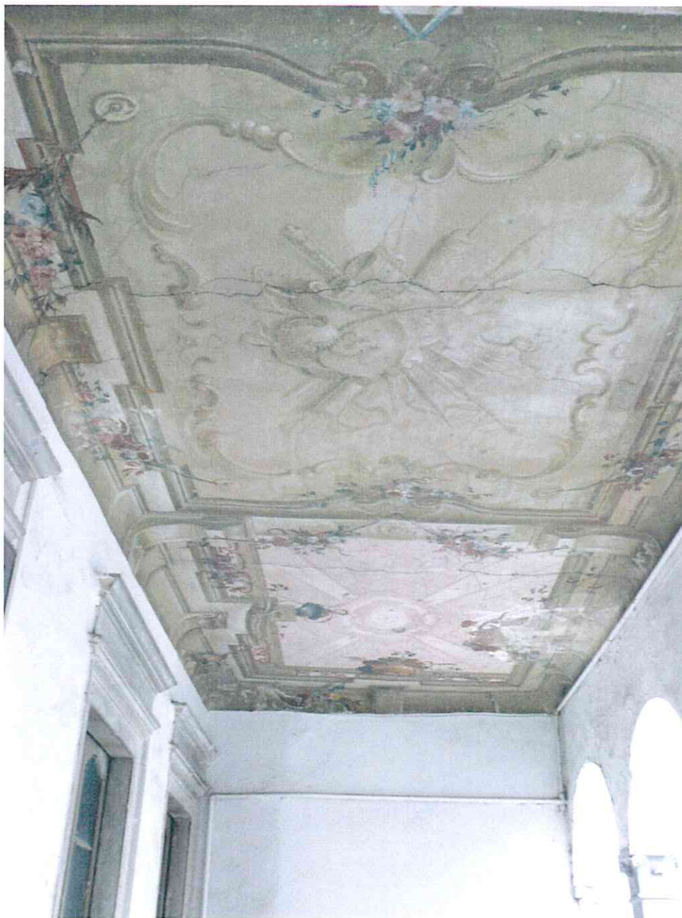
Affresco sul solaio del loggiato al primo piano del cortile principale